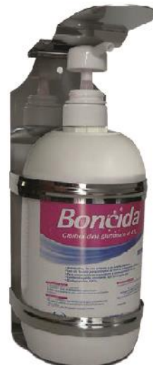
Soporte dispensador para presentación de 1 Litro.